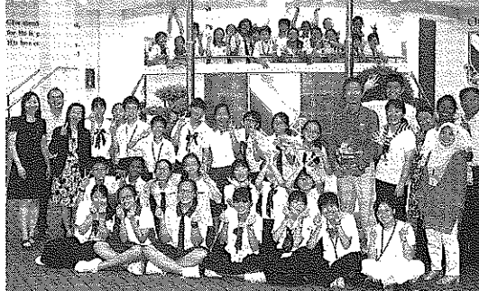
平成28年度第22回帰中町少年少女海外派遣事業報告書より