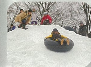
タイヤチューブジャンプ