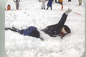
スノーフラッグス