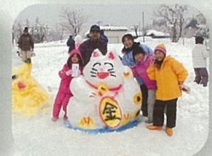
ミニ雪像コンテスト