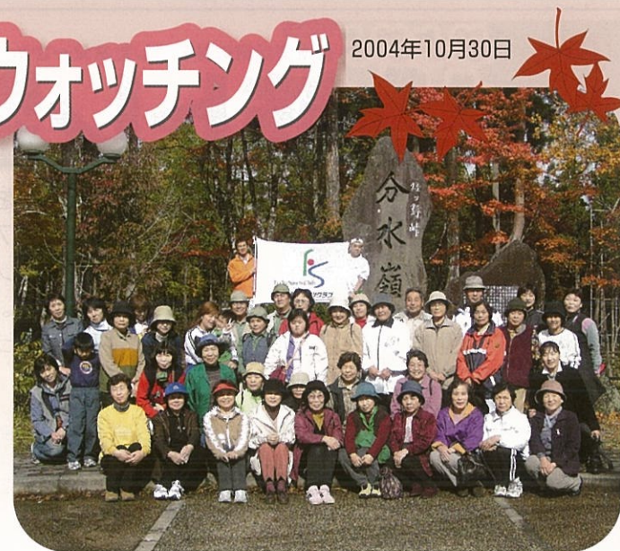
分水嶺にて参加者で記念写真

フラットでは来年度も自然観察教室を開催する予定ですが、上高地自然散策ツアーなども計画中です。乞うご期待。