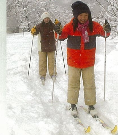
歩くスキーを楽しむ親子

雪の中で遊ぶこと少なくなった昨今、この日ばかりは寒さを吹き飛ばし、親子で楽しい一日を過ごしました。