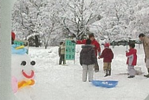
スノースラックアウト