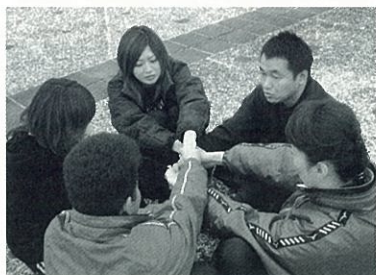
昨年好評だったPA研修会

研修会で、信頼関係を築くことでの自分自身への気づき・相手への思いやり・集団でのコミュニケーション力を養います。教室指導等でとても役立つ内容です。このように指導者の質向上に努めながら、会員さんの一番近くにいる指導者を通して皆さんの声を聞いていきたいと思っています。こんな我々にご協力していただける方を募集しています!