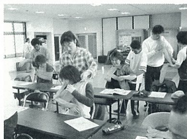
スポーツ救急救命講習

指導者部会では、5名のスタッフが月1回~2回フラット事務局で会合を行い、指導者の声を拾い上げたり、指導者及び一般向けの講習会を企画しています。