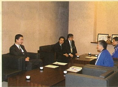
(財)富山市体協 東山専務理事に報告する柘山理事長