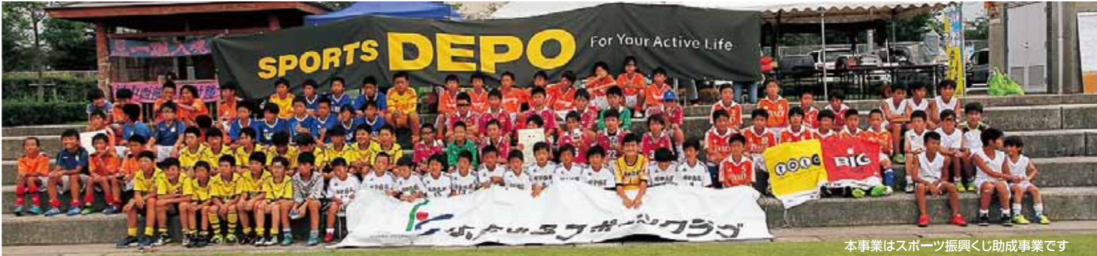
本事業はスポーツ振興くじ助成事業です