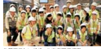
佐藤工業シンガポール支店現場視察