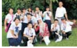
世界遺産ボタニックガーデン視察