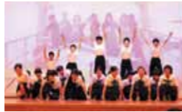
笑顔でパフォーマンスする団員