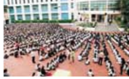
毎朝行われる朝の集会