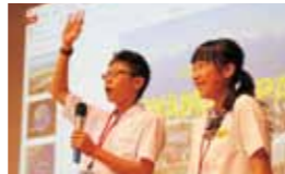
元気に富山を紹介する団員