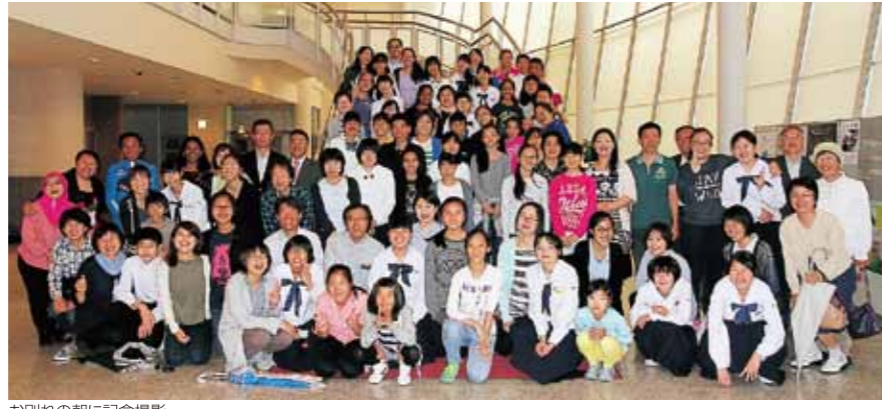
お別れの朝に記念撮影

5月25日(水)「富山県イタイタイ病資料館」と「ファミリーパーク」を視察。 5月27日(金)は速星中学校を訪問し、体験授業や給食、全校集会などで交流を深めました。 5月28日(土)は、婦中ふれあい館にて、日本の文化を体験、「華道」と「茶道」を行い、昼食は、ノベル・イングリッシュスクールの先生方が中心となり、シンガポールの中学生とホストファミリーが同じテーブルに座り、「おにぎりパーティー」を開催しました。シンガポールの中学生のなかには、おにぎりか初挑戦という子供もおり、見よう見まねでおにぎりを握っていました。 引き合わせ式では、ゲームやクイズを楽しんで、今まで以上の盛り上がりでした。終了後、それぞれのホストファミリーと一緒に各御家庭に行きました。 5月30日(月)早朝、2泊3日のホームステイを終え、お別れの朝を迎えました。別れを惜しみ、お互いが涙する姿に、充実したホームステイとなったことを感じました。