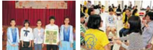
速星中学校での交流会