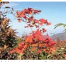
色付きはじめたカエデ紅葉