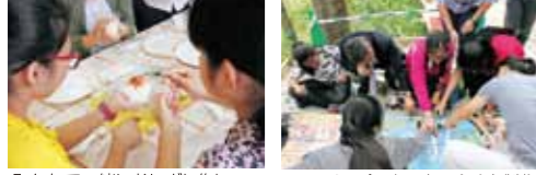
みんなで一緒ににおにぎり作り