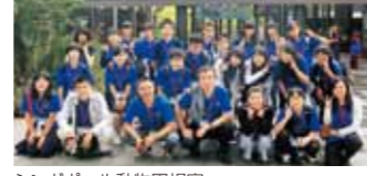
シンガポール動物園視察