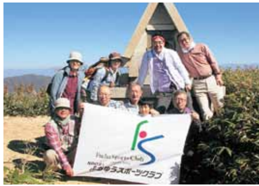
頂上にて記念撮影(奥に北アルプスを望む)