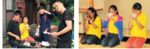
ホームステイ先にて